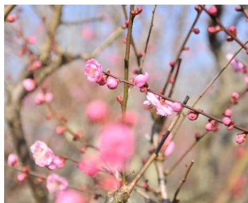
↑2月12日 (右上) 小梅 ・(右下) 紅梅